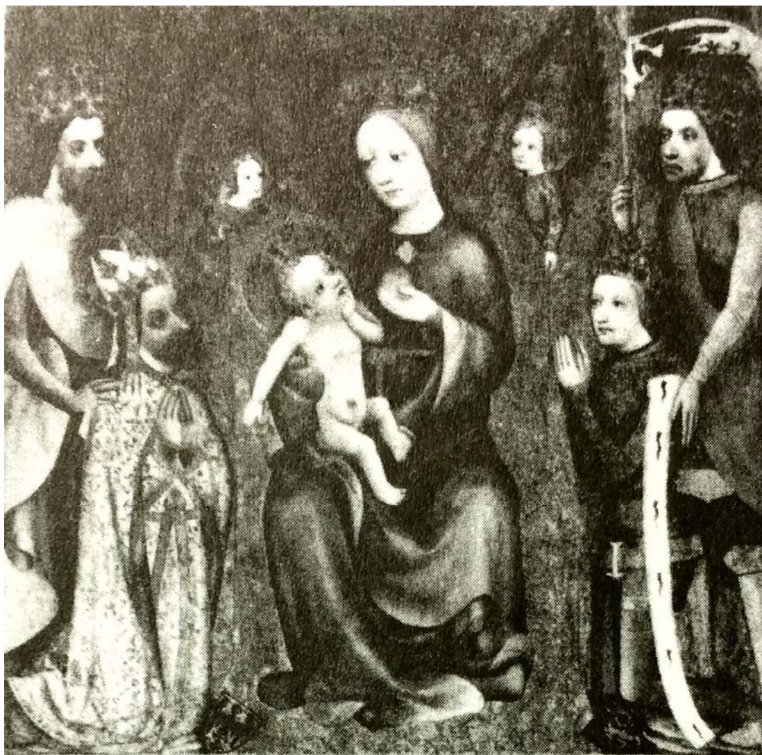
(Lexikon der christlichen Ikonographie, Freiburg im Breisgau 2015, Bd. 5, S. 26 Herausgegeben Wolfgang Braunfels)