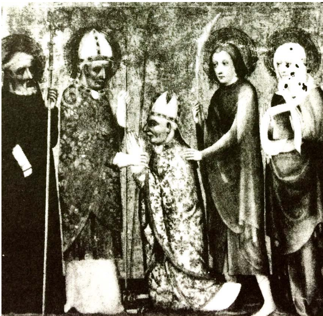
(Lexikon der christlichen Ikonographie, Freiburg im Breisgau 2015, Bd. 5, S. 26 Herausgegeben Wolfgang Braunfels)